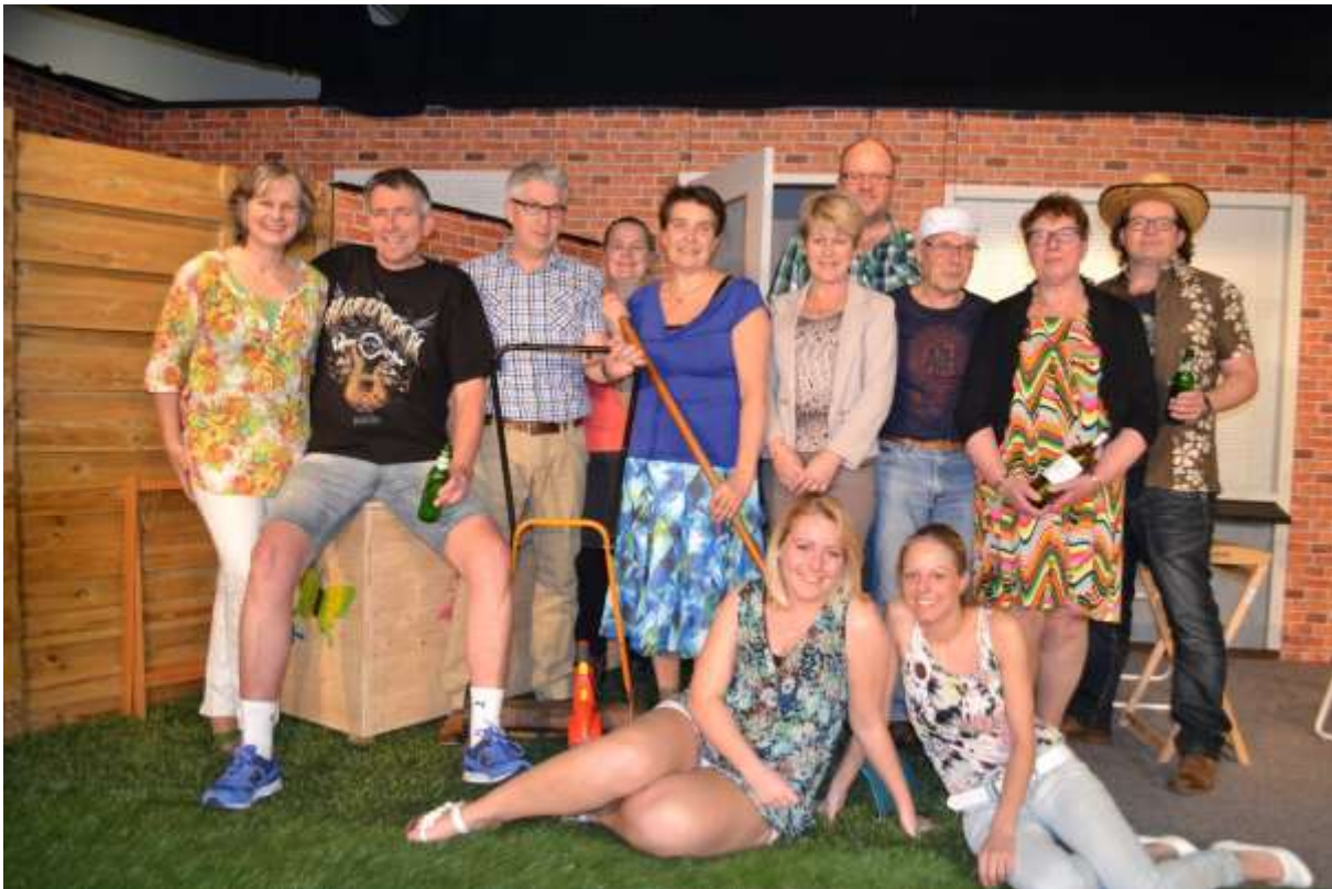
De cast van 2015.